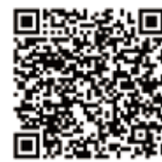
優惠加選報名連結 Cem Piskin Workshop Demo