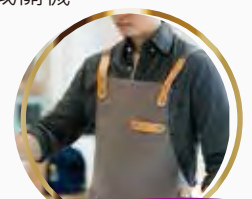
早鳥報名精美贈品