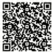
大會活動報名連結

永豐銀行 南門分行 代號：807-1077 帳戶：026-018-0001891-9 戶名:中華民國牙體技術學會